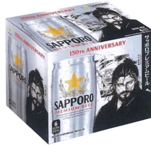
Phiên bản đặc biệt