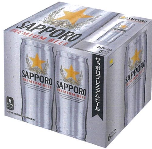
Phiên bản thông thường