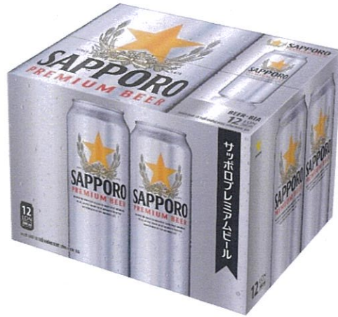
Phiên bản thông thường