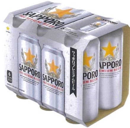
Phiên bản thông thường