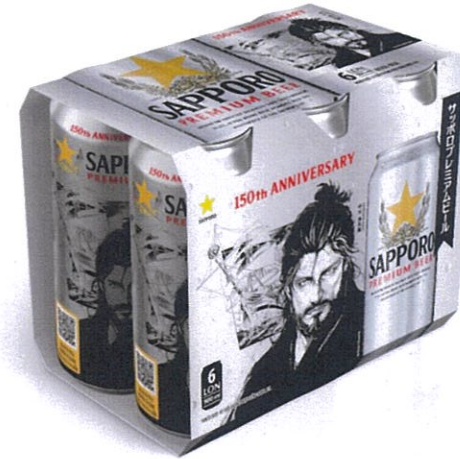
Phiên bản đặc biệt