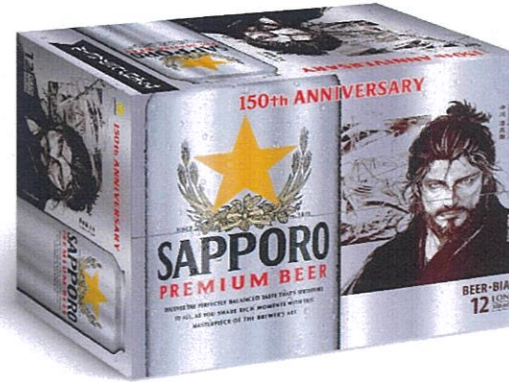
Phiên bản đặc biệt